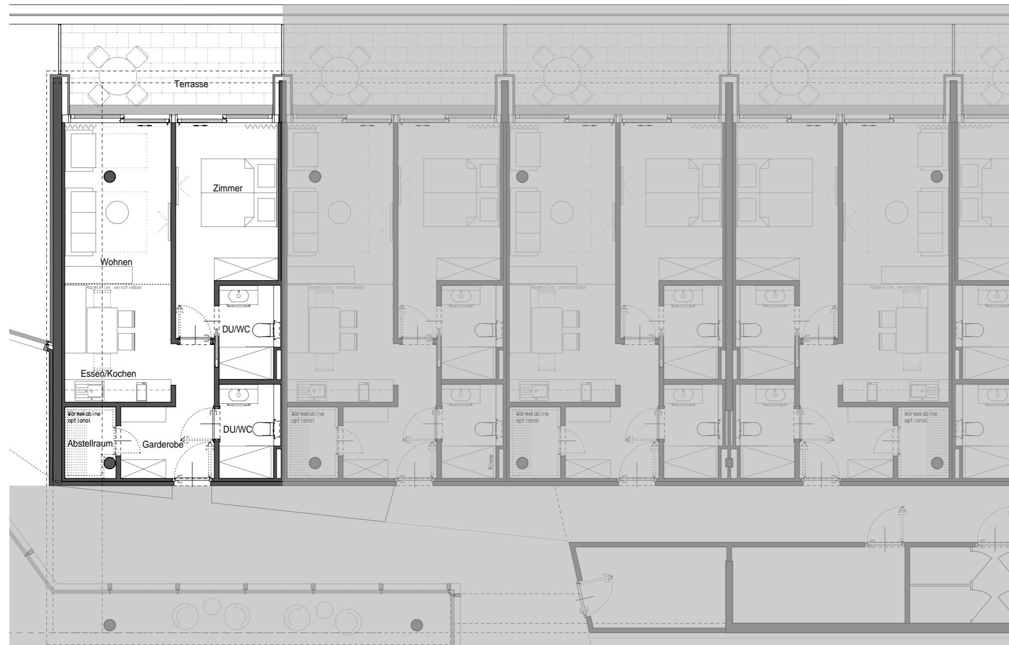
Grundriss Haus 3/Zwischentrakt E0 M 1:100